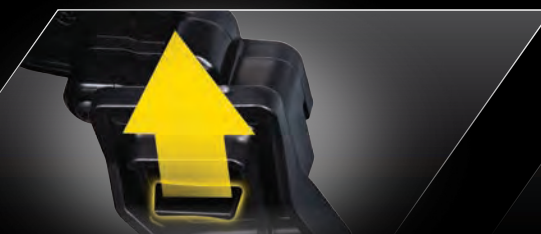
Clipless Body Mounting