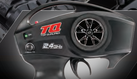
TQ™ 2.4GHz Radio System