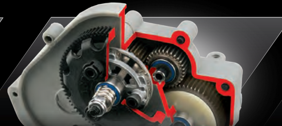
Torque-Control™ Slipper Clutch