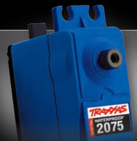
High-Torque Digital Steering Servo